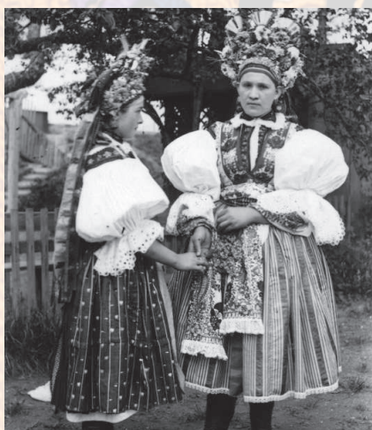
Družičky v obřadním kroji. Mařatice, kolem roku 1890.