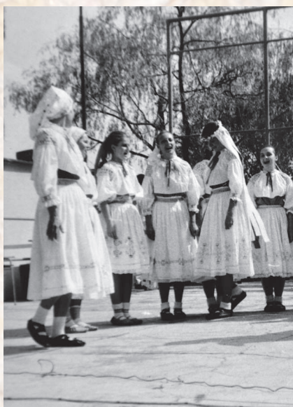
Scénické vystúpenie folklórnej skupiny z Valaskej Belej. Nedožery, okolo roku 1990.

V chladnom období nosili muži vrchné odevné súčiastky kabáty rovného strihu – haleni – zhotovené z bledého alebo bieleho súkna. Nemali žiadne zapínanie, ani vrecká na odkladanie drobností a jedinou výzdobou bolo lemovanie červenou vlnou. Na rozdiel od halien s hazuchou sa nosili oblečené vsunutím ruky do rukávovej časti a nie prehodené cez plece.