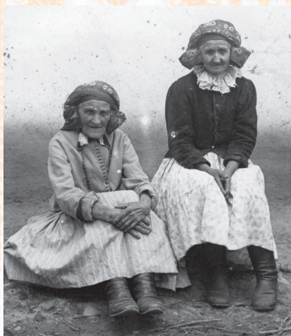
Stařenky v polosvátečním kroji. Kněždub, 1919.