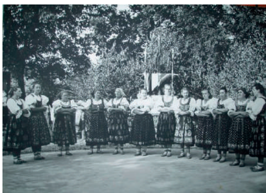
Folklorná skupina Lubená z Polusvia, koniec 20. storočia.