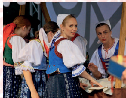
Súčasná podoba tradičného odevu z Poluvsia. Prievidza, 2016.