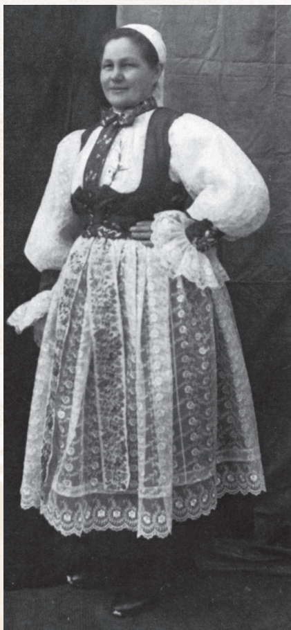
Žena vo sviatočnom odevu. Kľačno, tridsiate roky 20. storočia. Súkromný archív Ondreja Pösssa.

Najspodnejším ženským odevom bol rubáš – rubáč, pendel, pendohemb z konopného plátna, ktorý sa vyskytoval vo všetkých okolitých obciach. Uväzoval sa do kríža šnúrkami cez rameno. Skladal sa z dvoch pevne zošitých častí. Dolná sukňová časť bola ušitá zo šiestich kosých pôl domáceho konopného plátna, tzv. tlstého plátna, vrchnú časť tvorila tzv. činovať v šírke osemnásť až dvadsaťštyri centimetrov. Vzory tkaniny boli vyhotovené keprovou alebo ripsovou väzbou červeno-bielej alebo červeno-bielo-modrej farby. Rubáš nebol len spodný odev. V letnom období sa spolu s rukávcami a zásterou používal ako všedný a pracovný odev. Slúžil aj ako odev na spanie.