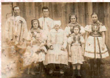
Suchovská rodina Zemčíků z čp. 95. Suchov, kolem roku 1924.