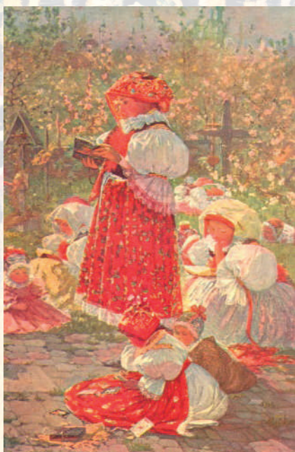
Naše mamičky (Na hřbitově), Uherskoostrožsko, 1893. Joža Uprka. Reprodukce pohlednice.