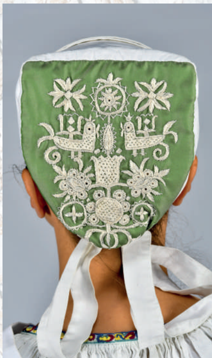
Pravnianska výšivka na dienku čepca.

skladané do malých skladov – fal'dov . Predná časť sukne – barsčo – nebola riasená, čím sa šetrila látka a túto časť nebolo vidno, prekryvala ju záster. Sukňa sa zaväzovala vpredu opásaním kupovaných tkaníc alebo – cigánskych tkaníc .