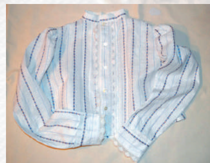
Polosváteční ženská jupka. Střílky, 2019.