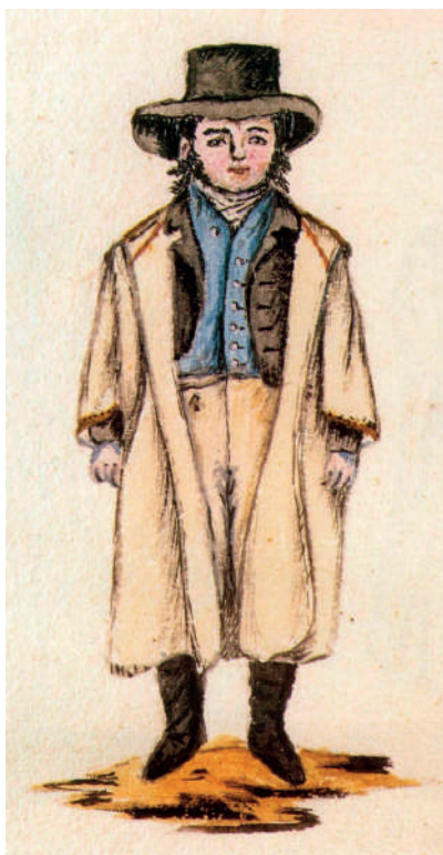
Muž ze Střílek (střílecký a zástřilzský sedlák). Panství Střílky, Hradištský kraj, 1814. Reprodukce z knihy.