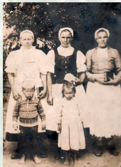
Ženy s deťmi. Nitrianske Rudno, okolo roku 1930.