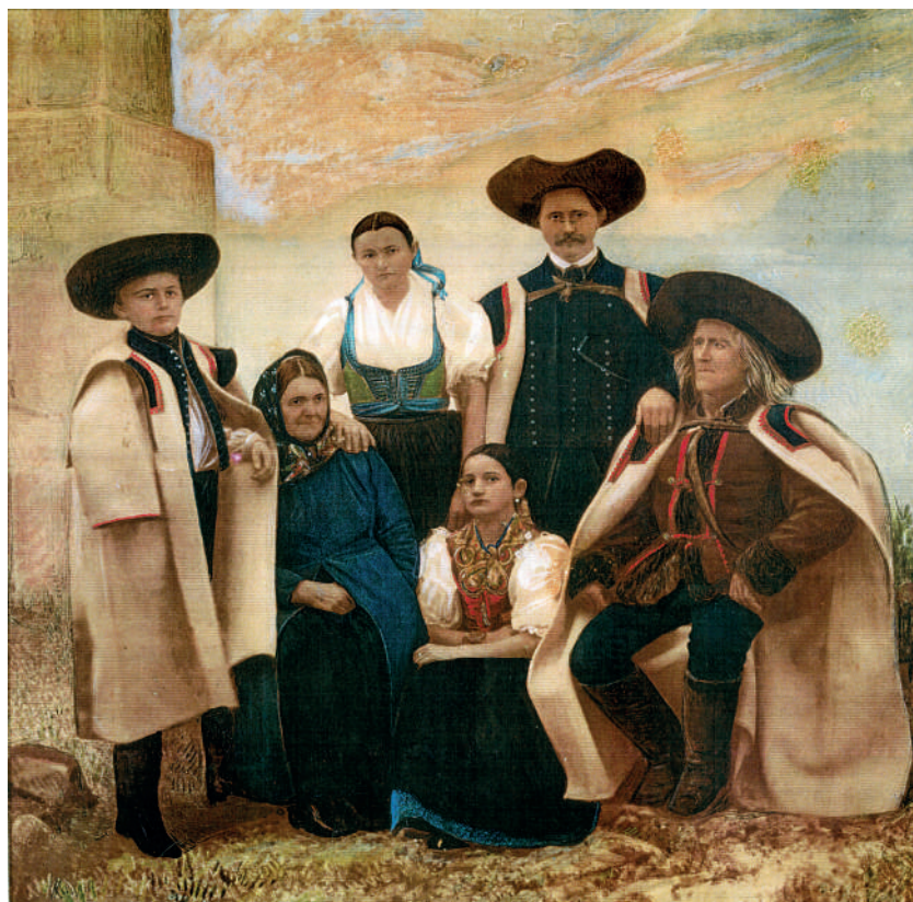
Príslušníci rodiny z Handlovej vo sviatočnom odevu. Kolorovaná fotografia, koniec 19. storočia. Reprodukcia z knihy.

Ako obuv nosili ženy najskôr len čizmy. Jeden pár na všedný deň a elegantné na bohoslužby. Majetnejšie dievky nosili na tancovanie topánky z jemnej kozľacej kože. Topánky sa dali objednať aj na jarmokoch. Okolo roku 1910 sa objavil typ poltopánok so zapínaním na kovové cvoky a remienky – schkrepizon .