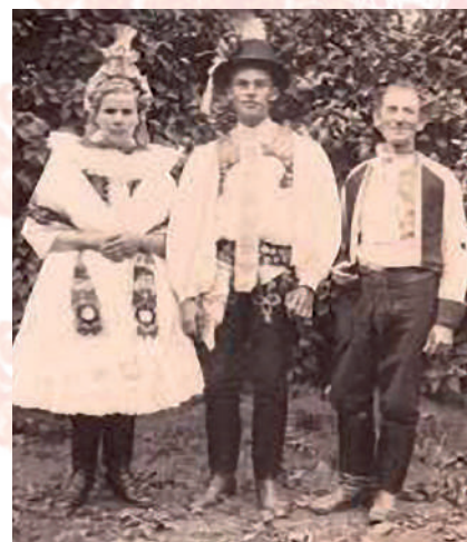
Nevěsta v obřadním pentlení a v úvodnici, ženich již v nohavicích s barevným vyšíváním a šňůrováním, starý muž v kalhotách s jednoduchým tmavým šňůrováním. Lipov, 1927.