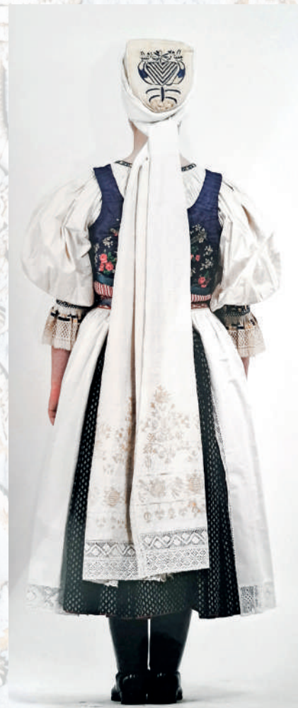
Rekonštrukcia obradového odevu nevesty po začepčení z Nedožier z 19. storočia. Reprodukcia z knihy.