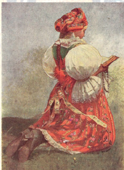
Děvče od Uherského Ostrohu, kolem roku 1910. Joža Uprka. Reprodukce pohlednice.