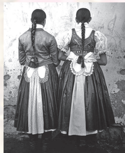
Dievčatá vo sviatočnom odevu. Zimná a letná verzia odevu. Handlová, začiatok 20. storočia.