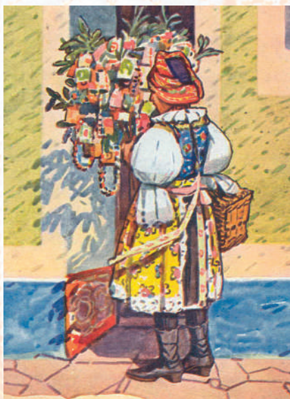
Žena ve slavnostním kroji. Pohlednice. Antoš Frolka. Na Smrtnou neděli v Tasově. Veselsko. 1919.