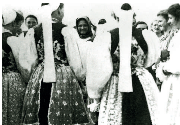
Ženy vo sviatočnom odevu. Kľačno, tridsiate roky 20. storočia.