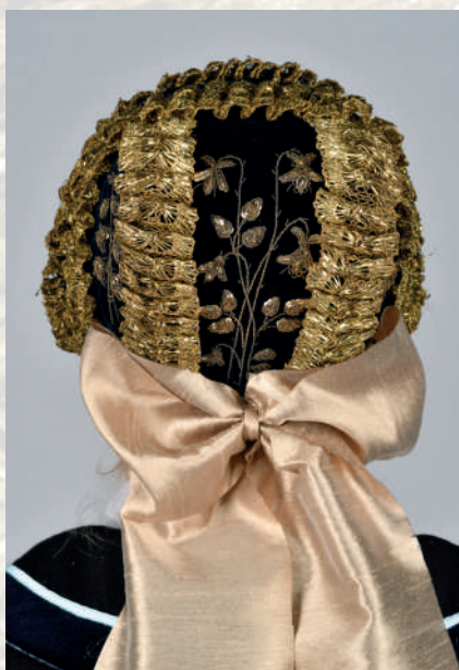
Detail čepca zlatohlavu – koke.