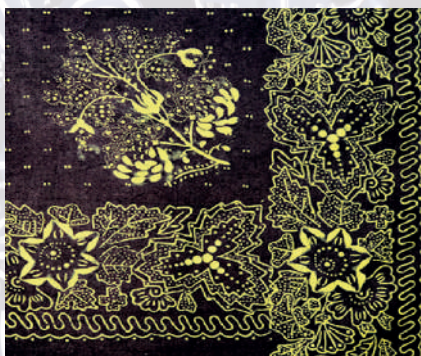
Detail vzorov na šatkách z modrotlače.

súkna. V chladnejších ročných obdobiach vymenili konopné gate za úzke vlnené – súkenné nohavice jednoduchého strihu. V prednej časti boli dva rázporoky, okolo ktorých sa sústreďovala výzdoba šnúrovaním. K súkenným nohavičiam patrila aj kožený remienok, v ktorom bolo zvyčajne zastrčené aj vrecúško na tabak.