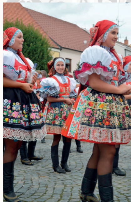
Slovácký rok v Kyjově, současná podoba krojů. Kyjov, 2019.