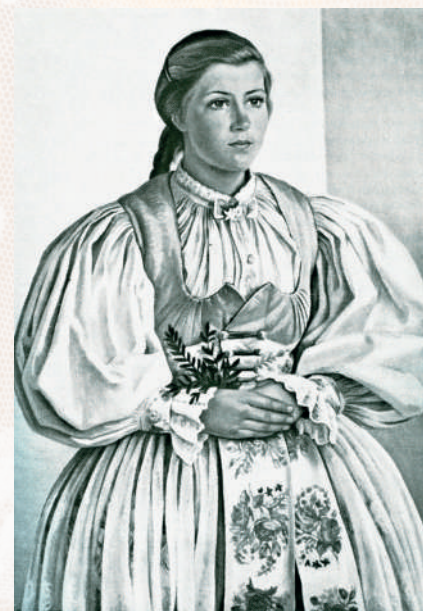
Kreslené vyobrazenie devy z Malinovej, nedatované. Autor neznámy. Súkromný archív Ondreja Pösssa.

Ako obuv nosili ženy krpce, v letnom období aj čierne poltopánky s jedným alebo dvomi remienkami na nízkom opätku, do ktorých si obúvali biele podkolenky alebo pančucháče. V chladnejšom počasí nosili čierne šnurovacie topánky siahajúce po členky, čierne kožené čižmy, v zime súkenné kapce.