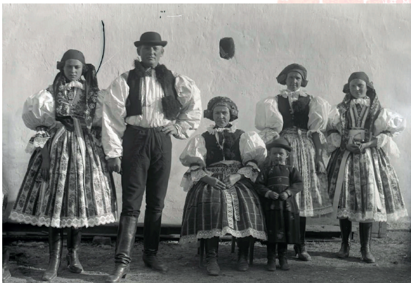
Rodina ve slavnostních krojích, ženy mají na sobě hedvábné (dívky) i soukenné vestičky (starší ženy), muž ve svátečním oděvu, chlapec v šatech – kanduškách. Ostrožsko, kolem roku 1900.