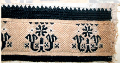
Nárameník, vzor na složitý kalich, kalich je tvořen dvěma tulipány a květem. Blatnička, kolem roku 1870. Fond Slovákého muzea v Uh. Hradišti.

– kánkou, vrchní korunkou – věncem z růžic k uším, z věnce – šilionu, ze stuh visících na zádech – visáku a zadní mašle s růžů. Dnes toto neobvyklé a působivé svatební pentlení tvoří jeden sešitý čepce posítý prýmky, zrcátky, umělým kvítím, patáčky, na uších je zdoben modrými růžemi, na zádech splývají slovácké barevné stuhy až do poloviny fěrtochu . Čepení nosí dívky k bílému fěrtochu při obřadních příležitostech církevního a rodinného charakteru, např. k biřmování, o Božím těle, k primicím, o svatbě, k pohřbu i k hodům, v Blatnici dnes dívky nosí k obřadnímu pentlení černý šorec.