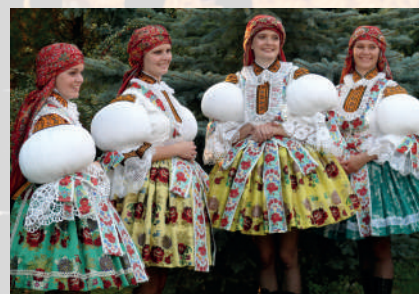
Současná podoba kroje. Slavnostní kroj mladých dívek hodové chasy. Polešovice, 2005.