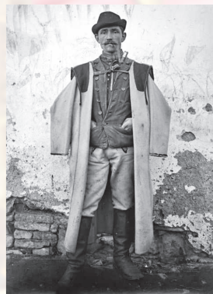
Muž vo sviatočnom odevu. Handlová, začiatok 20. storočia.