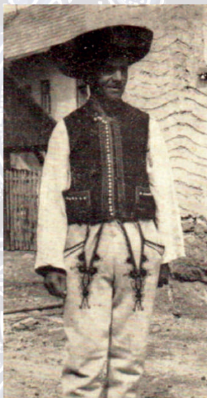
Mužský sviatočný ľudový odev z Jalovca, rekonštrukcia 1968. Reprodukcia z knihy.

Dve dvojité šírky perkálu sa zošivali spojovacím švíkom niťou alebo priadzou vo farbe základnej tkaniny alebo mulinkou či vyšivacou bavlnkou vo farbe zelenej alebo modrej. Na zošitie sa používal jednoduchý spojovací švík alebo vedľa seba ukladané slučkované zúbky – mriežki . Zástery boli riase – rámené alebo husto drobno skladané. Obalok v šírke 7 cm sa prešival štepovaním v dvoch radoch čiernou niťou. Na viazanie sa používali kupované bavlnené tkanice. Viazali sa vpredu na uzol, pričom konce museli byť rovnako dlhé a siahali až po kolená. Pri opleckách s dlhým stanom sa používala užšia zástera, zhotovená z 2 pôl tmavomodrého alebo čierneho perkálu a po roku 1910 k nemu pribudol aj čierny glot. Obalok zástery v prostriedku zužoval zámik, čím obalok dostával oblúkový tvar. Zástery sa šili strojom a zdobenie vytváralo štepovanie hodvábom vo výraznejších farbách (červenou alebo hráškovozelenou farbou).