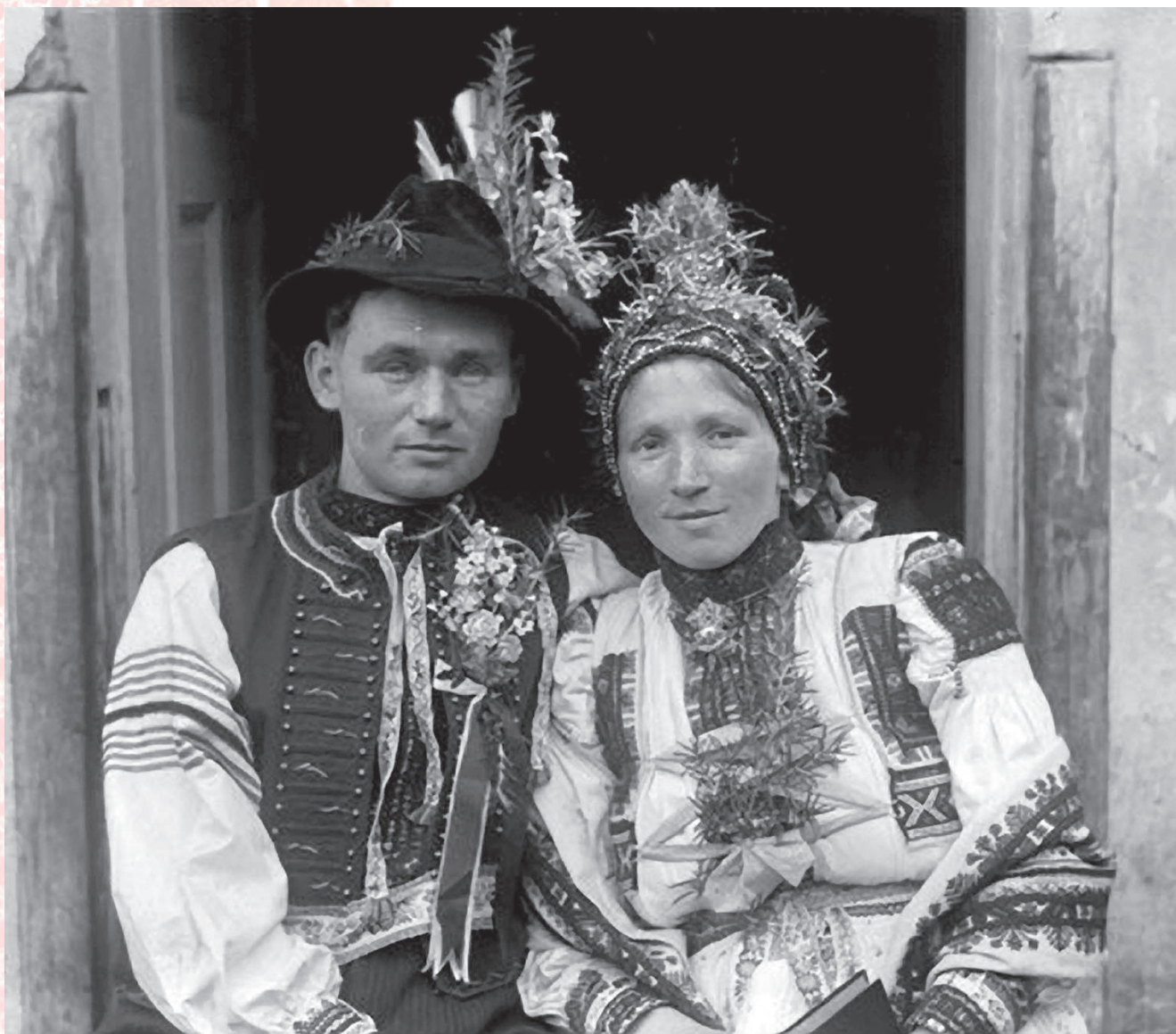
Novomanželský pár v obřadním kroji z Kapanic. Starý Hrozenkov, kolem roku 1900.

Uvedený katalog je součástí mezinárodního projektu Interreg CZ-SK, pro který byl na moravské straně vybrán výzkum příhraniční moravsko-slovenské oblasti, konkrétně bádání v oblasti tradiční oděvní kultury Slovácka, v jeho podoblastech Uherskohradištsko, Kunovicko, Uherskoostrojsko, Veselsko, Hornácko, Kyjovsko, Buchlovicko a na slovenské straně v oblasti Podjavorinské a Myjavské kopanice.