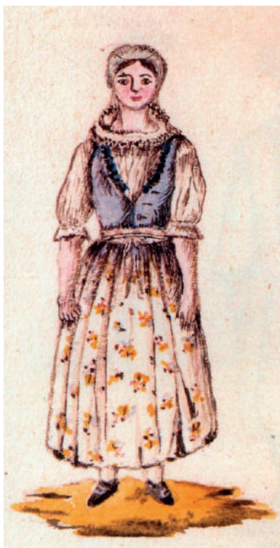
Dívka ze Střílek (střílecká a zástřilzská selka). Panství Střílky, Hradištský kraj, 1814. Reprodukce z knihy.