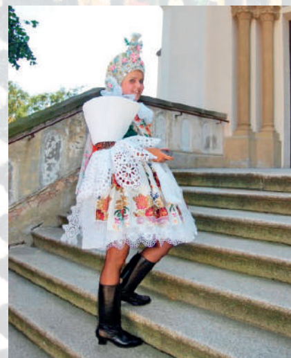
Současná podoba obřadního kroje Ostrožska, přední sukň z brokátu, vytkávaném kovovými nitěmi, družička má na hlavě obřadní pentlení. Ostrožsko, 2010.

Nejvýraznější ženskou obřadní součástí kroje je vysoké pentlení – čepení , do něhož bývaly zapentleny nevěsty a družičky. Obřadní pentlení ostrožského typu je tvořeno stužkou nad čelem – čelovou pantlou , dýnkem – vrkočem , čelenkou