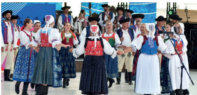
Súčasná podoba ľudového odevu z Polusvia. Folklorná skupina Lubená, 2025.