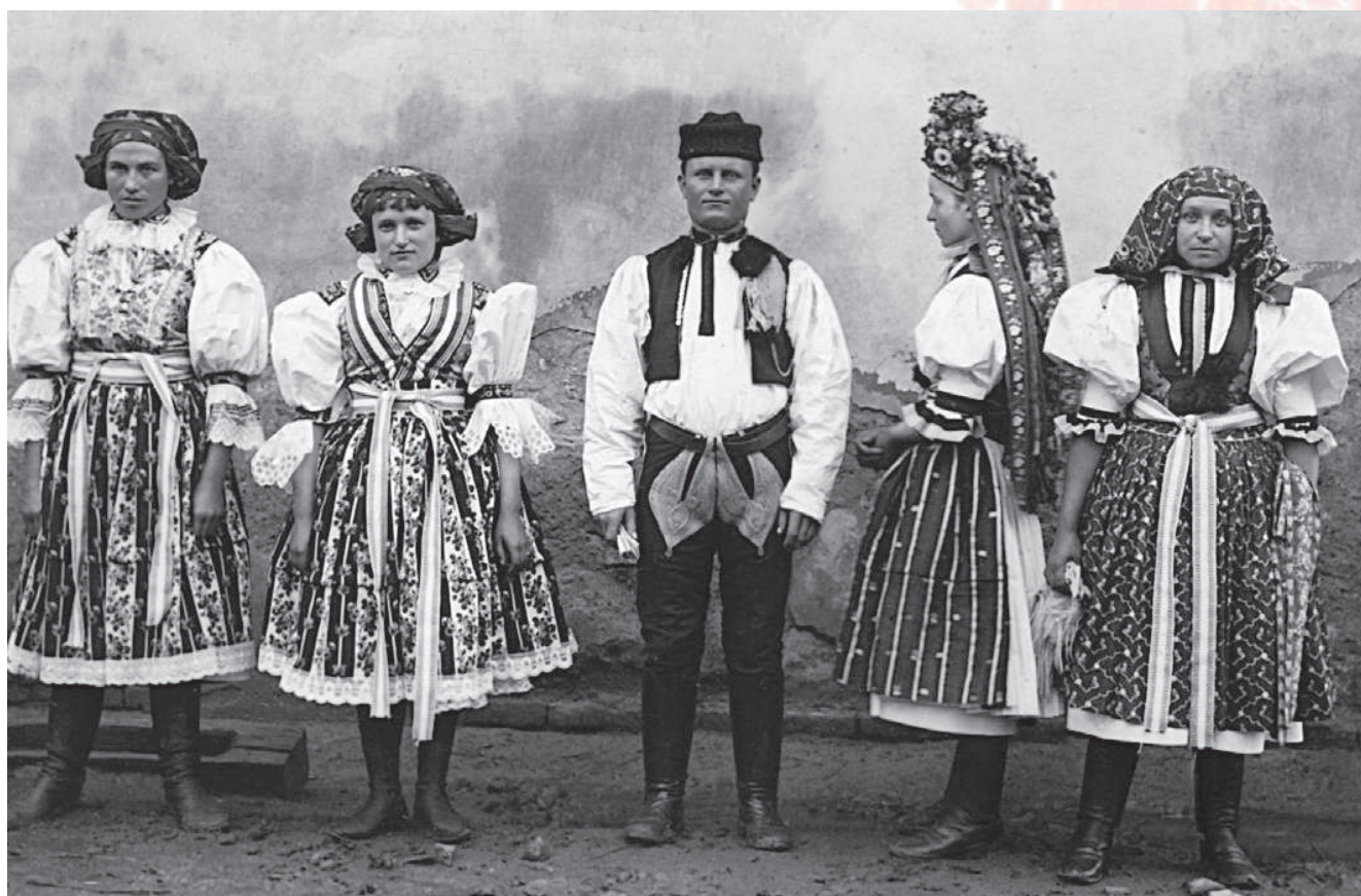
Podoba mužského a ženského kroje z Kunovic, mládenec v astrigánce bez příkras, dívka s obřadním věncem, děvče v úvazu na záušnice, vlevo dívky z Ostrožské Nové Vsi, 1890.