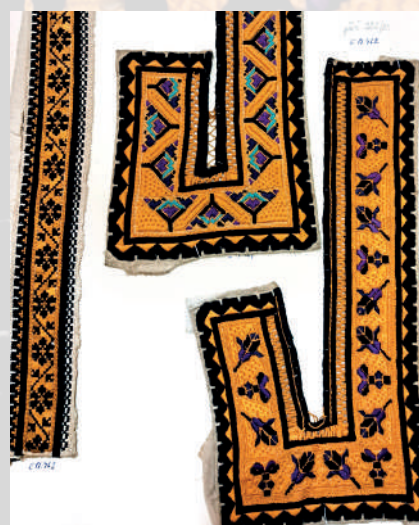
Výšivka podle počítané niti na hrubý výřez, Uherskohradištsko, Polešovice. Fond Slovákckého muzea v Uh. Hradišti. Foto Romana Habartová.