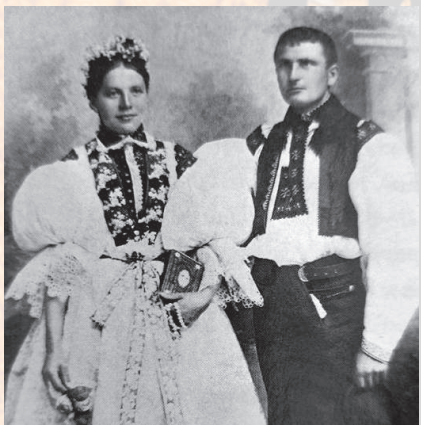
Novomanželé v obřadním kroji. Staré Město, 1905. Z fondu Slovákčého muzea v Uh. Hradišti.

oblečení, muži odkládali kroj a pořizovali si selské obleky , které měly své místo v šatníku už na konci 19. století.