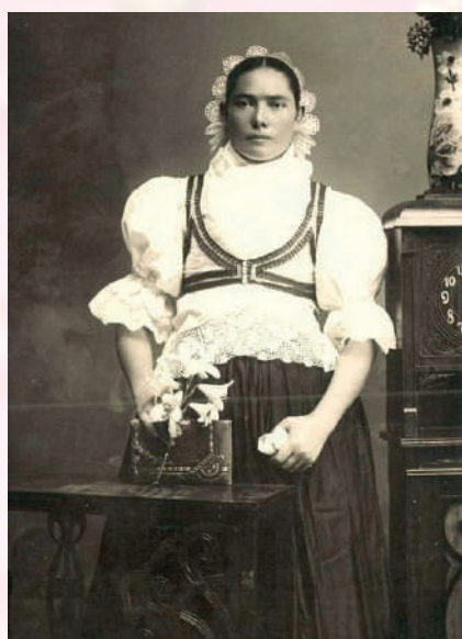
Mladá žena vo sviatočnom odevu. Handlová, 1915.

súkenkom. Muž mohol mať počas života dve haleny. Keď jednu opotreboval, nechal si ju na robotu a novú mal sviatočnú – do kostola. Je pravdepodobné, že farba lemovania kabátika a haleny závisela aj od veku, pričom u mladých to bola modrá farba a u starších mužov červená. Halena sa nikdy neobliekala do rukávov. Rukáv sa z vnútornej strany zašival, aby sa doň mohli dať fajka, dohán alebo iné drobnosti. Niekedy si mladí muži v rukáve schovávali kameň, ktorý poslužil pri bitke, keď prudkým otočením tela zasiahol protivníka. Ženich zvyčajne dostal svoj kep na svadbe, ktorý ho potom sprevádzal celý život.