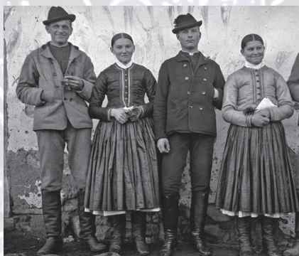
Dievky a mládenci v zimnom odevu, začiatok 20. storočia.