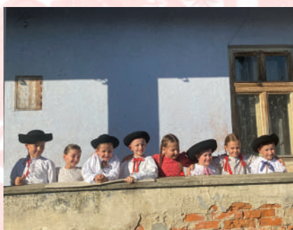
Súčasná podoba detského odevu. DFS Barka.

– ručníky – s drobným vzorom a širokou bordúrou a nadrobno riasené sukne – skladaňice – s drobnými vzormi, zástery – záponi , záponki – zhotovené z dvoch pôl a zošité spojovacím stehom a pre mužov boli určené obdĺžnikové šatky, ktoré sa nosili uviazané okolo hrdla.