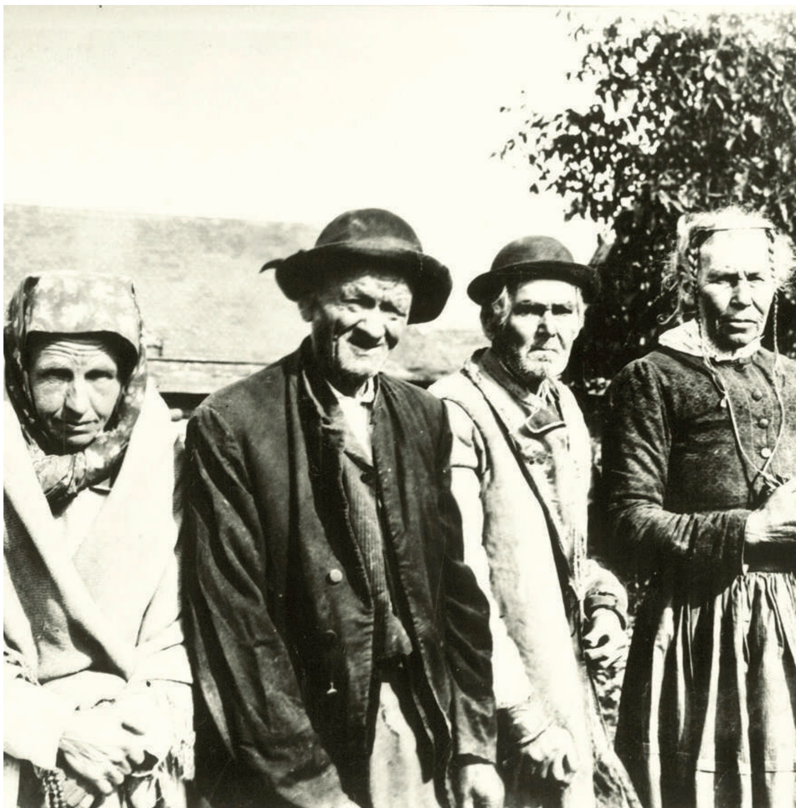
Lidový oděv nejstarší generace. Kunovice, kolem roku 1895. Soukromý archiv.