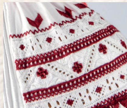
Detail výšivky na rukávcoch z Čavoja.