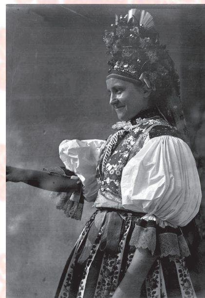
Dívka v obřadním kroji z Hradištska, konec 19. století.

K hlavním kritériím pro vymezení etnografických celků patří lidové stavitelství, dialekt, lidová hudba, píseň a tanec, ale také viditelný znak, kterým je lidový oděv. Každý z uvedených ukazatelů aplikovaný samostatně poskytuje jinak vymezenou oblast, která se navíc v čase proměňovala a nadále proměňuje (některé regiony se rozšiřují na úkor jiných). Proto je obtížné vytvořit přesně ohraničenou mapu moravských národopisných oblastí, subregionů a dalších podoblastí.