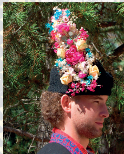
Mužská pokrývka hlavy beranice-astrigánka s obřadní ženichovskou vonicí. Kunovicko, 2013.