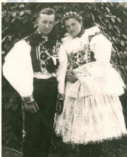
Svatební pár v obřadním kroji s viditelnou proměnou tvaru rukávů ženy, jejich vypodložení a lomení, místo obřadního pentlení má na hlavě věneček z umělého kvítí. Ostrožsko, kolkem roku 1940.