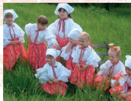
Imitace kroje, děti ze Střílek. Střílky, kolem roku 2007.