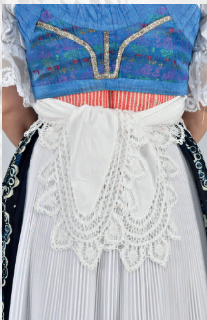
Konce kosiny ozdobené háčkovanou čipkou. Nedožery.