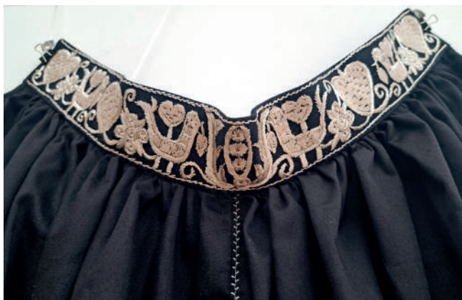
Detail pravnianskej výšivky na opasku zástery, vzor spojovacieho stehu, autor Andrej Richter.