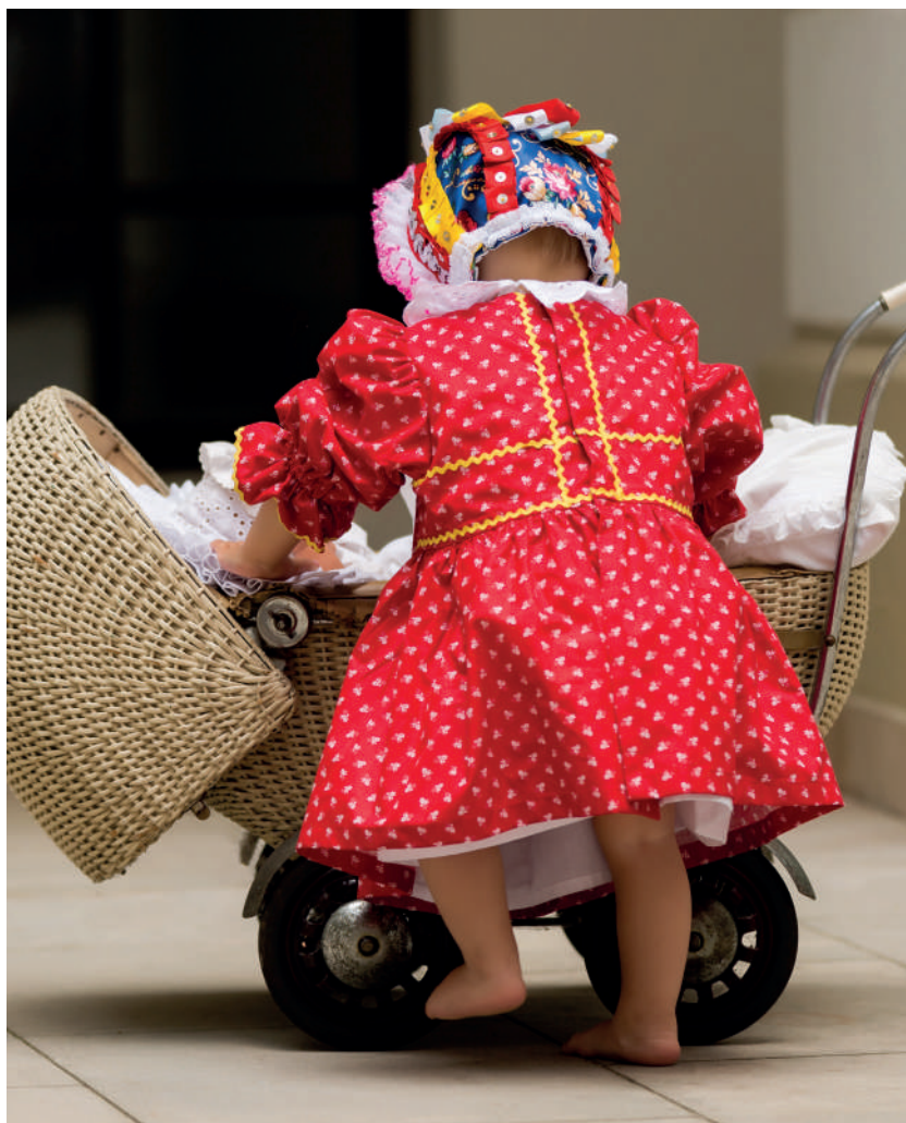
Současná podoba lidového oděvu batolete. Děvčátko v šatičkách-kanduších. Ostrožsko, 2020. Soukromý archiv.

Pro tuto oblast byla podle ikonografických dokladů, dobových fotografií a trojrozměrných oděvních kusů muzejních a soukromých sbírek navrženy a zhotoveny rekonstrukce slavnostního a obřadního ženského, mužského a dětského lidového kroje, situovaného do období 1860–1920.