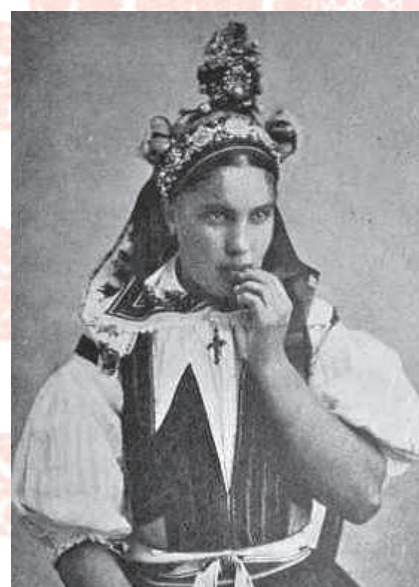
Nevěsta v pentlení. Velká nad Veličkou, 1895.