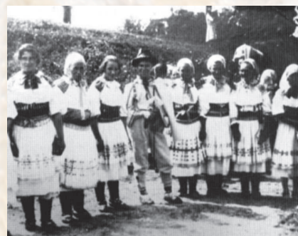
Družičky s družbom. Valaská Belá, nedatované. Reprodukcia z knihy.

Väčšiu časť roka chodili takmer všetci bosí a ženy neboli výnimkou. Na sviatok sa žena ustrojila tak, že si na nohy navliekla vlnené podkolenky, spevnené krúžkom z gumy – štrupandlami , a potom si obula kožené krpce s čiernymi vlnenými šnúrami – návlakmi .