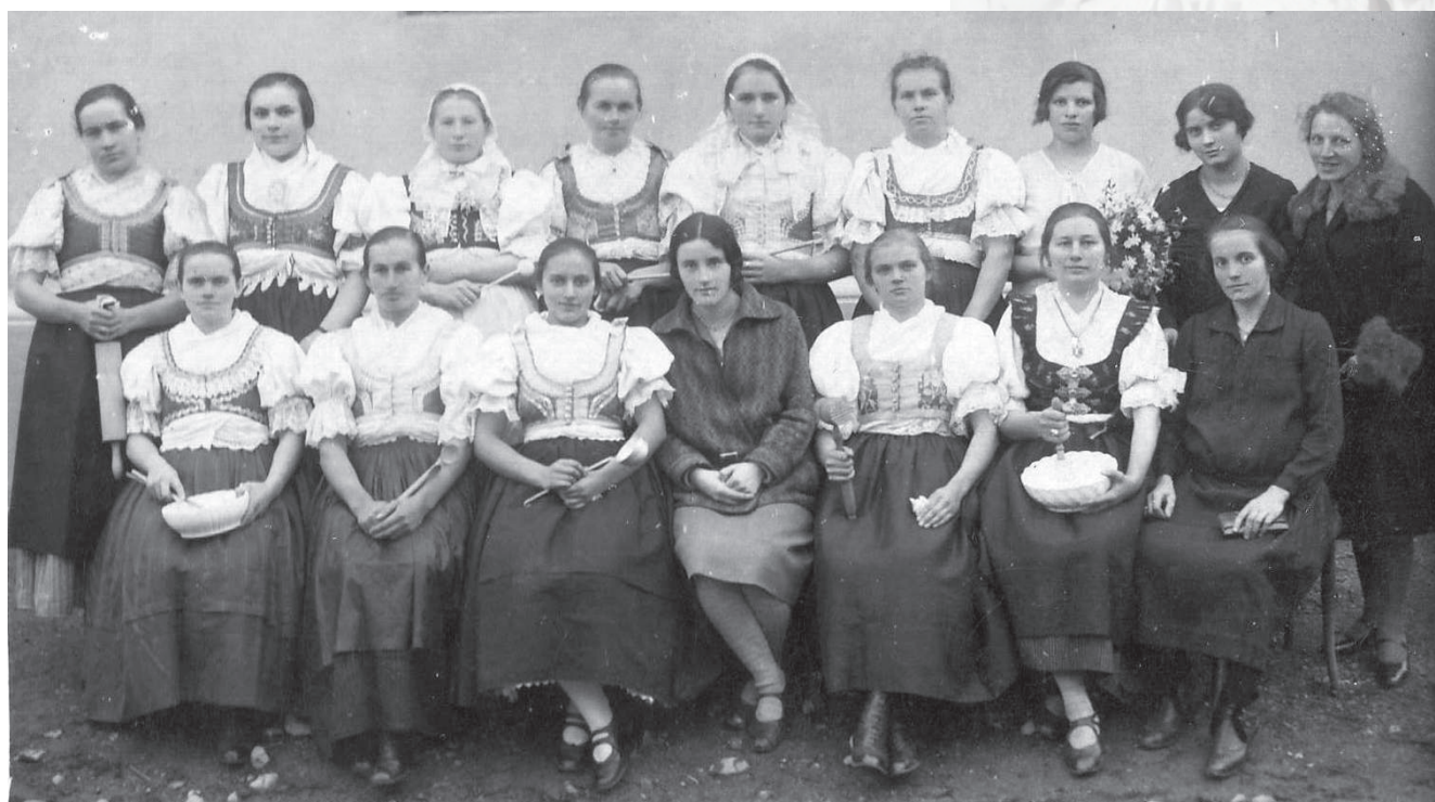
Absolventky kurzu varenia. Brezany, dvadsiate roky 20. storočia. Archív obce Nedožery-Brezany.