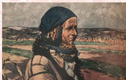
Stará žena v modrotiskovém tzv. harfenickém šátku s úvazem na záušnice, s konci pod bradu. In: Joža Uprka. Vázání šátků, 1910.

Geograficky je Slovácko odděleno od Brněnska a Hané Ždánským lesem a Strážovskou pahorkatinou. Na severu je lemováno Chřiby či Hříběcími horami, které jsou známé jako Buchlovské hory, na severu a severovýchodě je Slovácko ohraničeno úpatím Javorníků, na východě se táhne od Vlárského průsmyku až ke Strážnici pásmo Bílých Karpat s vrcholy Javořinou a Lopeníkem. Horské a podhorské části Slovácka se snižují do rovin a údolí, jejichž středem protéká Olšava a Morava se svými přítoky, Kyjovkou a Dyjí.