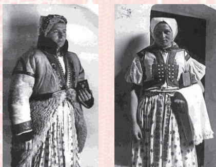
Zleva: Žena v kožíšku. Velká nad Veličkou, 1919. Soukromý archiv. Žena v šatce s plachetkou. Velká nad Veličkou, 1920. Soukromý archiv.