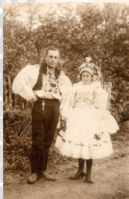
Novomanželský pár v obřadním kroji. Ostrožsko, první polovina 20. století.