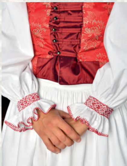
Detail ženského sviatočného odevu z Novák a okolia.