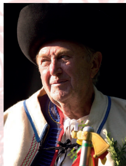
Rekonštrukcia odevu starejšieho z Poluvsia. Prievidza, 2017.