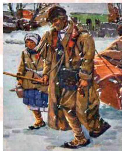
Výřez obrazu: Zaváté cesty . Antoš Frolka. Pár obutý v kožených krcpích. Horňácko, 1927. Soukromý archiv.

Pokrývky hlavy žen i v Lipově tvořily šatky, čepce, šatky. Unikátní jsou čepce a šatky svou výšivkou na koncích šatky a na dýnku čepce, jsou nejstarobylější součástí ženského kroje na Horňácku. Základní úpravu hlavy žen představovaly vlasy učesané na pútec , do lelíků , svázané tkaničkami na temeni hlavy, ve svátky nosily svobodné dívky barevné stužky. Ženy měly jako základní rozlišovací znak obálenky a čepce . Šatky se objevují od konce 19. století. Bílý s barevným tiskem se říkalo lipské . Výroba byla u nás rozšířena už v 18. století v České Lípě, Kosmonosích či Mladé Boleslavi. Šatky tu jsou napevno uvázané a vyztužené – a mohou být červené – turecké , už zmíněné bílé s barevným potiskem – lipské , bílé s červeným nebo