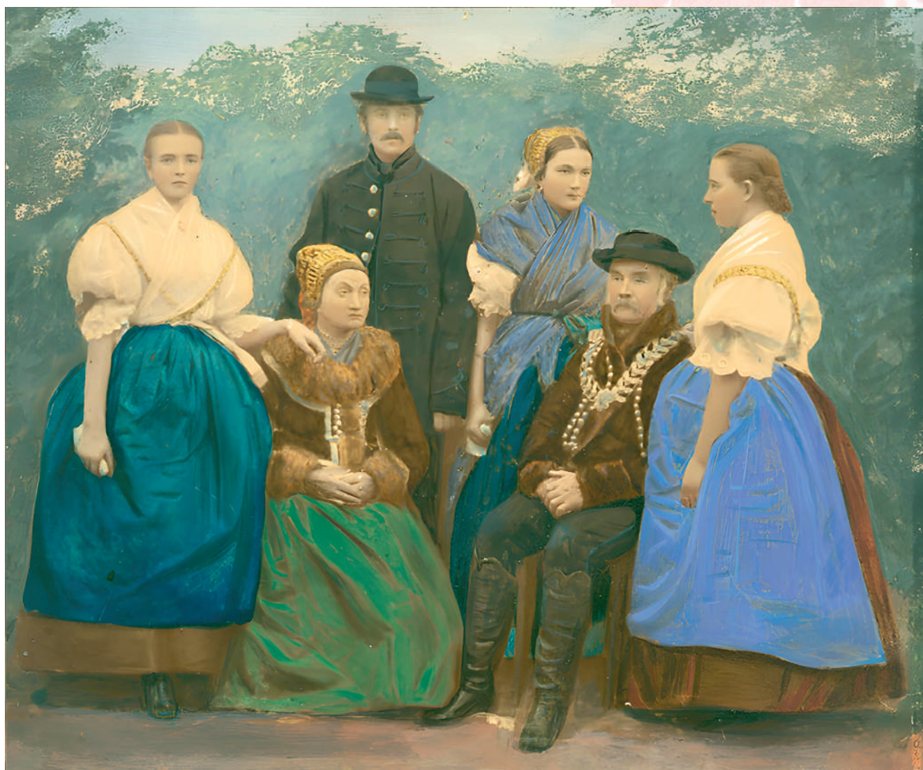
Príslušníci rodiny z Prievidze vo sviatočnom odevu. Kolorovaná fotografia, koniec 19. storočia. Reprodukcia z knihy.

Rozmanitosť tradičných odevných súčiastok s množstvom zachovaných archaických prvkov dokazujú, že región hornej Nitry rozhodne nie je chudobný na tradície .