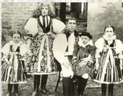
Mladá rodina ve slavnostních krojích kunovického okrsku. Kolem roku 1915.