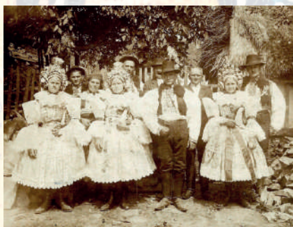
Obřadní kroj Ostrožska. Blatnice pod Sv. Ant., počátek 20. století. Soukromý archiv.