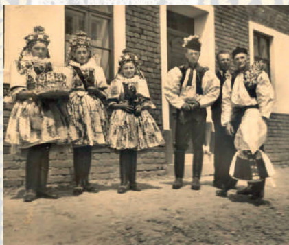
Obřadní oděv kunovického okrsku - nevěsty, ženicha, družiček a družby. Kunovice. Kolem roku 1935. Soukromý archiv.