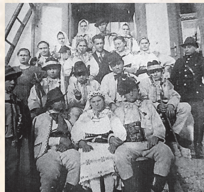
Svadobníci. Temeš, nedatované. Archiv obce Temeš.