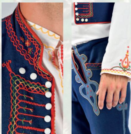
Detail výzdoby na kabátiku z mužského odevu z Novák a okolia.