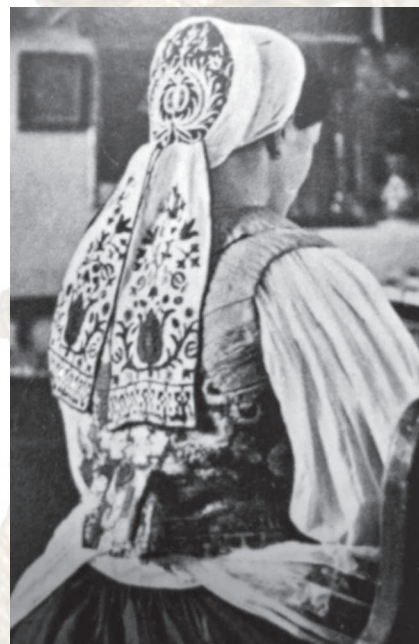
Uviazanie čepca s tapkami. Nitrianske Pravno, druhá polovica 19. Storočia. Reprodukcia z knihy.