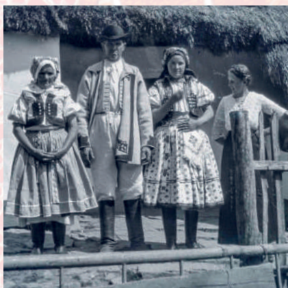
Horňácká rodina před stavením. Horňácko, kolem roku 1900.