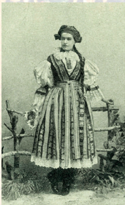
Dívka v hedvábné kordulce, volných baňatých rukávcích a v úvazu šátku na naušnice hore konce. Ostrožsko, 1898.