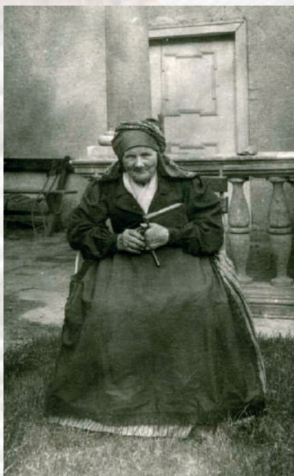
Stará žena v kroji, jediná fotografie s vyobrazením oděvu ze Střílky. Střílky, okres Kroměříž, 1892.