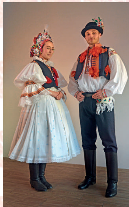
Rekonstrukce ostrožského kroje podle muzejních sbírek z let kolem 1890.

Slovem imitace označujeme nápodobu něčeho, připodobnění nějaké věci k jiné věci. Imitace se může realizovat i v oblasti hotovení napodobeniny krojového oděvu, který už není krojem, ale má vzbuzovat tento dojem. Jedná se o nápodobu původní předlohy s imitováním a zjednodušováním ve všech stavebních prvcích a detailech, včetně možné deformace stavebních prvků původní předlohy, případně vzniká bez ní a je výsledkem osobité představy autora.