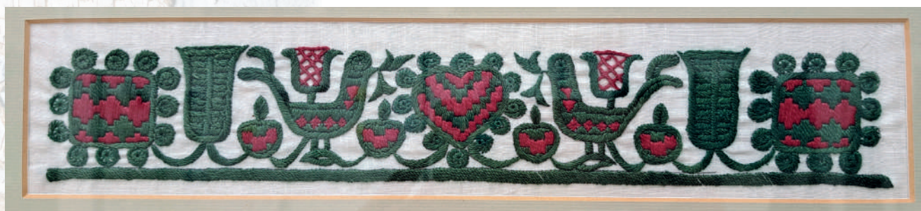
Detail pravnianskej výšivky na obalok rukávov, autorka Martina Richter. Archív RKC v Prievidzi.

Svadba sa radila k významným sviatočným príležitostiam a k nim patrilo i zodpovedajúce obutie, najčastejšie kožené čižmy so sárou siahajúcou do pol lýtok a s nevysokým podpätkom.