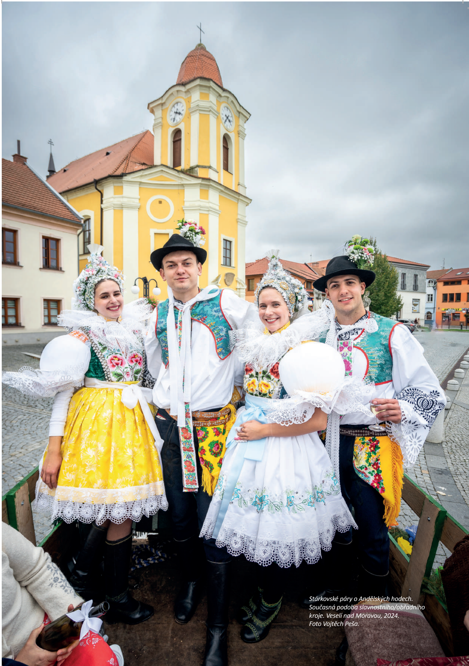
Stárkovské páry o Andělských hodech. Současná podoba slavnostního/obřadního kroje. Veselí nad Moravou, 2024.