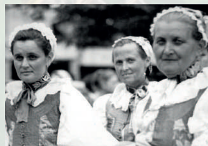
Ženy pri slávnostnej príležitosti. Zemianske Kostofány, nedatované. Reprodukcia z knihy.