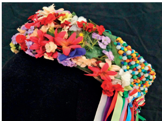
Detail svadobnej party nevesty zo zbierky folklórnej skupiny Hájiček z Chrenovca-Brusna.