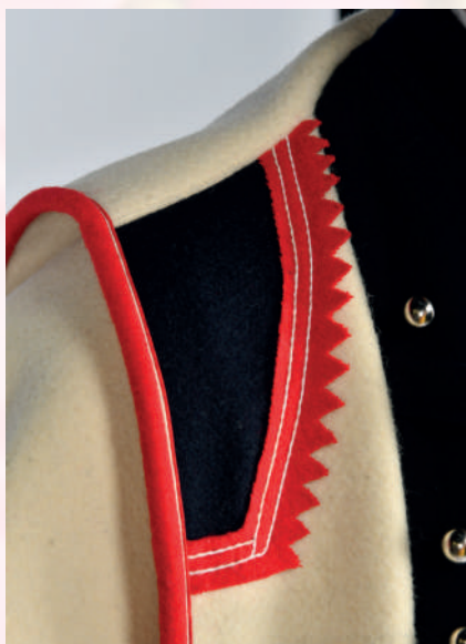
Zrkadielko na klope haleny.