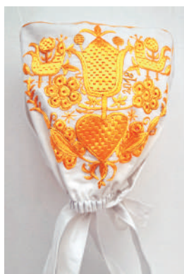
Detail pravnianskej výšivky na dienuk čepca, autor Andrej Richter.