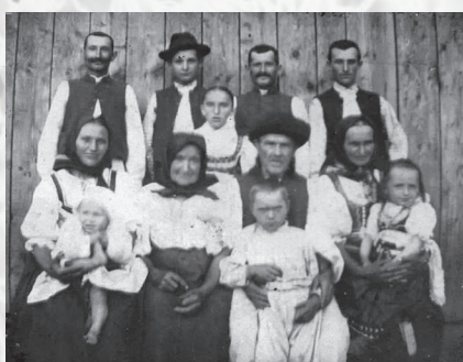
Rodina pri sviatočnej príležitosti. Nedožery, 22. 8. 1909.

stiahnuté šnúrkou v úzkom tunelíku tesne nad laktami a ukončené boli bavlnenou alebo vyšívanou tylovou čipkou.