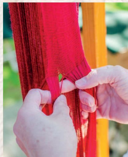
Tkanie pásu na krosienkach. 2016.