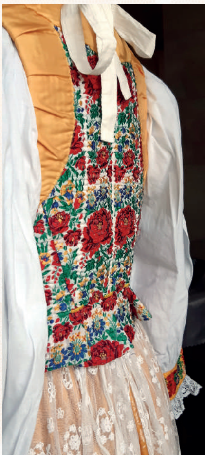
Detail lajblíka a zástery z vyšívaneého tylu.