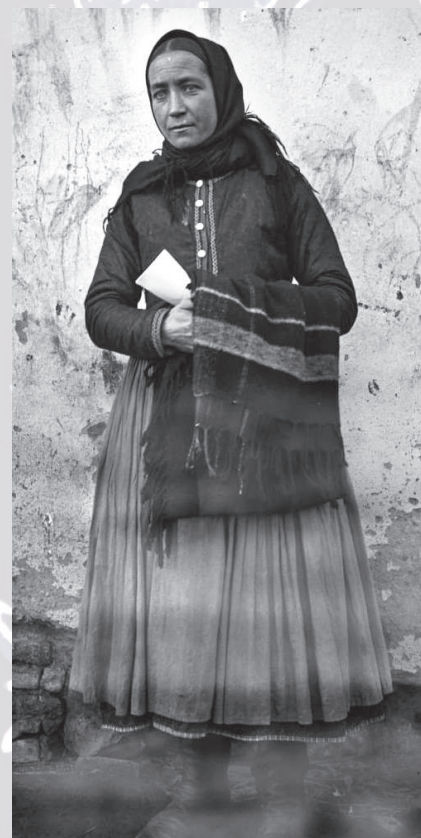
Žena v zimnom odevu. Handlová a okolie: Nová Lehota, Jalovec, Chrenovec, začiatok 20. storočia.

Pracovné zástery – záponi – sa šili z 2 pôl konopného (tenkého niťového) plátna alebo hrubšieho farbiarskeho plátna. Materiál na zásteru bol riasený alebo husto skladaný do opaska – obalka . Na uväzovanie sa používali cigánske i povojníkové tkanice alebo keprovka. Zápona obopínala postavu a siahala až po okraj sukne. Na robotný deň v letnom období si ženy na rubáš obliekli oplecko s obalkami a opásali si tmavú širokú zásteru. Pri samotnej práci ľavý cíp zástery zakasali za obalok sukne na pravom boku, prekryli prednú časť zástery, ktorá tak zostala čistá aj po prípadnom zašpinení súčiastky. Na jarmokoch si ženy kupovali tmavomodrú alebo čiernu, tenkú, lesklú farbiarsku látku – šuštiaci perkál, ktorú používali na zástery na sviatočné príležitosti.