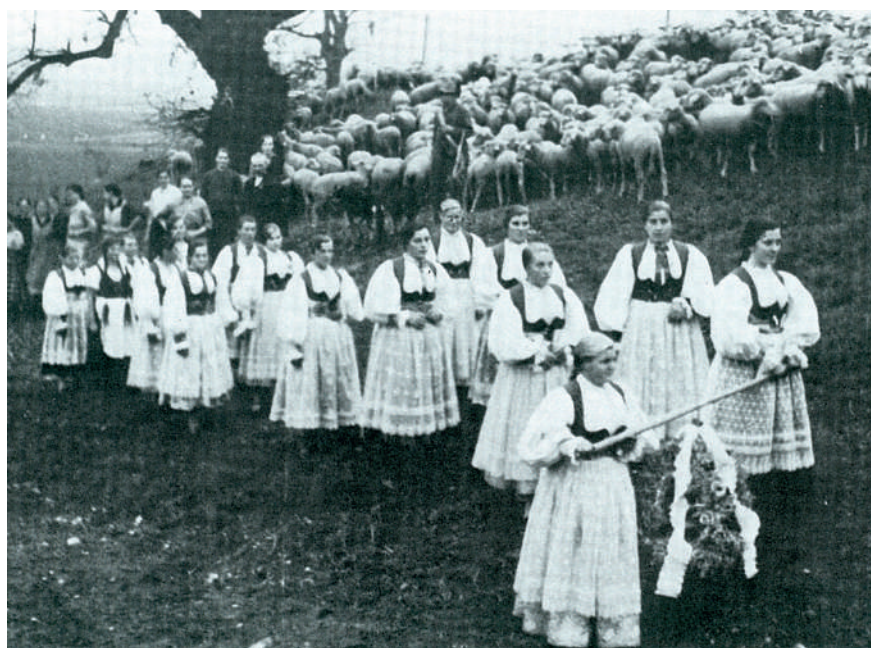
Dožinková slávnosť. Tužina, 1937.