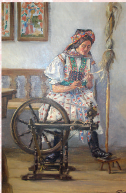
Žena ve svátečním kroji v jizbě při práci. Výřez obrazu Ludvíka Ehrenhafta, Horňácko, kolem roku 1900. Soukromá sbírka.