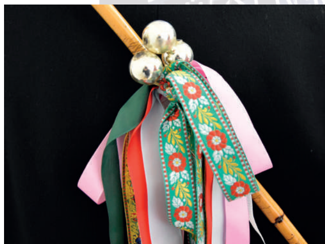
Detail obradovej palice družbu.