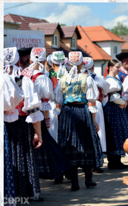
Súčasná podoba ľudového odevu z Polusvia. Folklorná skupina Lubená, 2022.