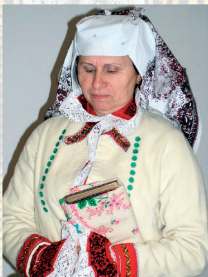
Starší žena v obnovené sváteční podobě kroje Kunovicka, v zimním lajblu a lipském šátku uvázaném na rožky, detail výšivky. Kunovice, 2015.

přednicích. Tento typ kabátku na začátku 20. století nahradily kabátky typu sametové kabaně , moldonky z vlněné, vícebarevné, pruhované nebo kostkované látky – moldonu , a později plyšové kacabajky . Ty nahradily v odívání žen kožichy, které do třicátých let 20. století postupně zanikaly. Název vznikl z vlastní funkce upjatého oděvu, který těsně obepínal nejen horní část těla, ale i boky. Doprovodnou součástí upjaček se stal vlnák, který ženy přehazovaly podle potřeby přes kacabajku nebo přes hlavu. Na konci 19. století začaly ženy nosit jako doplněk všedního oblečení svrchní halenky – jupky z kartounu různých barev a tisků, často z téhož materiálu jako přední sukně. Ve 20. století pronikaly i do svátečního a nedělního kroje jako náhrada za lajble a kabaně .