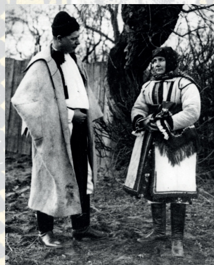
Muž v haleně a v beranici-astrigánce, žena v kožichu a tureckém šátku uvázaném na rožky. Kunovice, 20. století. Soukromý archiv.

Svrchní kabátek – lajbl ze světlého nažloutlého flanelu nebo jemného krémového sukna je starším typem ženského kabátku pro období jara a podzimu. Ozdobou jsou štíhlé protáhlé klopky u krku a k zápěstí ohrnuté manžety rukávů, vyložené jasným červeným sukem a vyšité jemným rostlinným motivem. Starší ženy měly výložky nezdobené, mladší ženy a parádnice si je nechávaly vyšít rostlinným motivem, hedvábním. Pod lajbl ženy oblékaly starší vyšívané rukávce , jejichž kadrlé přečnívaly k dlaním. Zdobným prvkem jsou dvě mírně zešíkmené řady původně malých bílých porcelánových knoflíčků na obou