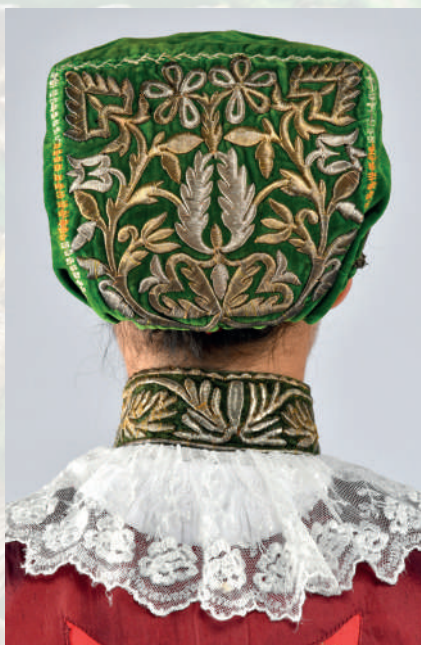
Detail výšivky cez kartón na dienkú čepca a krézli.