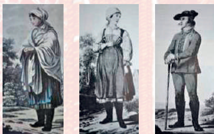
Grafické listy Georga Kiningera, 1802.