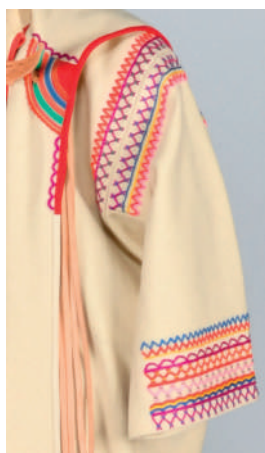
Detail výšivky a zdobenia mužskej haleny.