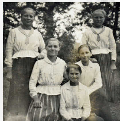
Žiačky v školskom roku 1935/1936 v Brezanoch.