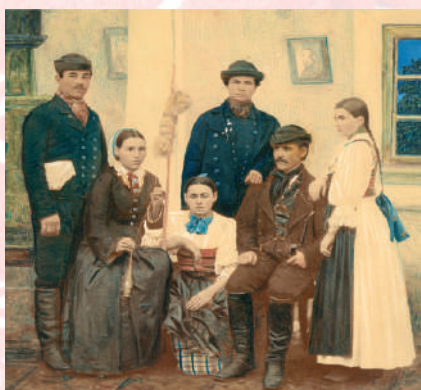
Príslušníci rodiny z Vestenic vo sviatočnom odevu. Kolorovaná fotografia, koniec 19. storočia. Reprodukcia z knihy.