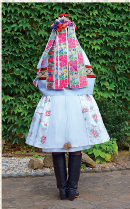
Rekonstrukce obřadního kroje kolem roku 1925 pro nevěstu a družičky. Kunovicko, 2018.