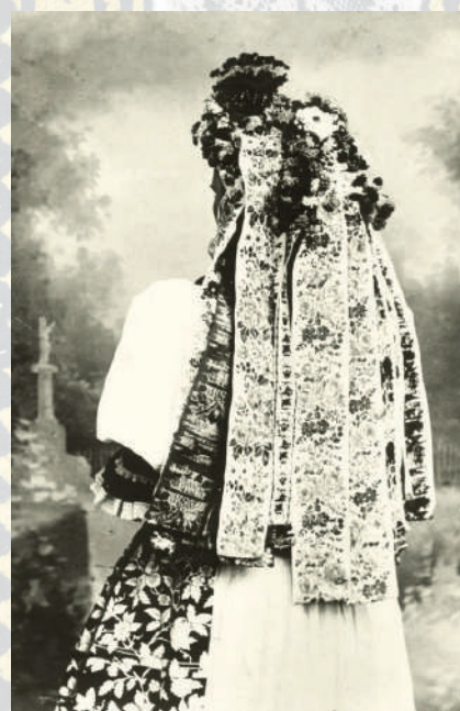
Dívka v pentlení z Kunovic, pohled zezadu na tzv. ocas , 1890.