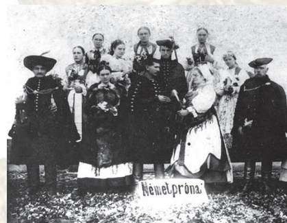
Účastníci svadby, Nitrianske Pravno, koniec 19. storočia. Reprodukcia z knihy.