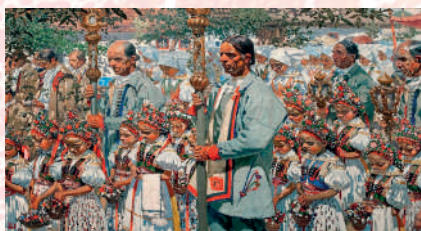
Muži v halenách a obřadních světlých kabátech. Reprodukce obrazu J. Uprky: Z Božího těla ve Velké, 1912. Reprodukce z knihy.