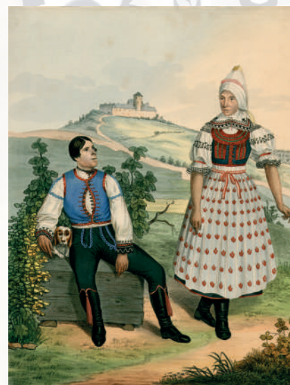
Litografie Wilhelma Horna: Svobodný a manželský pár z panství Milotice (Svatobořice, Mistrín). Brno, 1836. Sbíрка Etnografického ústavu MZM Brno.