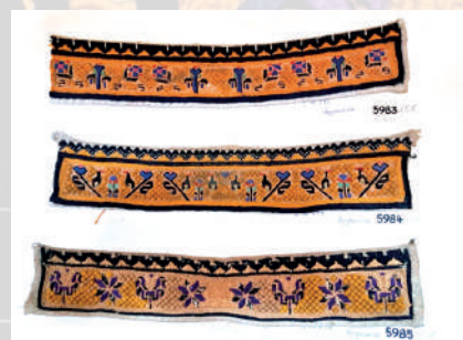
Výšivka podle počítané niti na hrubý výřez, Boršice, Polešovice, Nedakonice. Fond Slovákckého muzea v Uh. Hradišti.