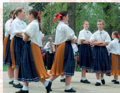
Stylizace krojů ze Strání. Dětský folklorní soubor Děčka z Kunovic, 2015.