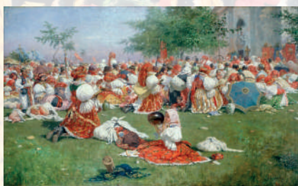
Pouť u Sv. Antonínka nad Blatnicí – v popředí lidé z Ostrožska a Kunovicka. Blatnice, 1894. Joža Uprka. Reprodukce pohlednice.