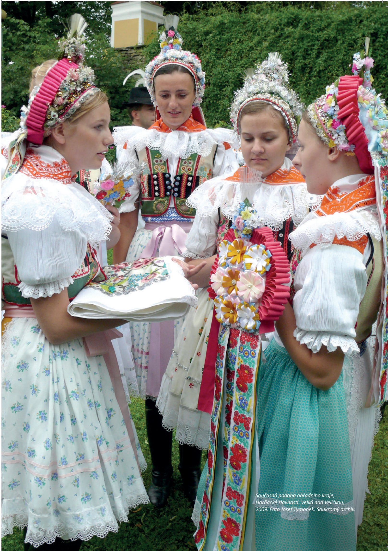
Současná podoba obrádního kroje, Hornácké slavnosti. Velká nad Veličkou, 2009.