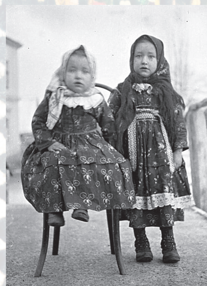
Děvčátka v tradičním lidovém oděvu – v šatičkách – němkyňích a šátku. Ostrožská Lhota, 1908. Soukromá sbírka.