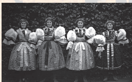
Dívky ve slavnostním kroji. Polešovice, 1908.