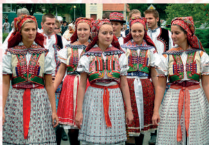
Současná podoba slavnostních horňáckých krojů. Horňácko, 2009.

černým potiskem – brněnské , bílé s jemným černým potiskem – lehké smutkové , bílé se strojově vyšitým vzorem, po obvodu je plátno roztřepené, tzv. strapkové .