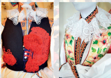
Rekonstrukce - tmavě modrá soukenná ženská kordulka, zdobená ruční výzdobou-cifrováním a výšivkou, hedvábná atlasová kordulka, rukávce s kompletním vyšíváním (kolem roku 1890). Ostrožsko, 2013.