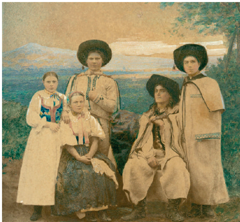
Príslušníci rodiny z Diviak (nad Nitricou) vo sviatočnom odeve. Kolorovaná fotografia, koniec 19. storočia. Reprodukcia z knihy.

Mladé ženy chodievali bosé alebo v krpcoch , ktoré si na nohu pripevnili obťahčianím návlakov , dlhých tenkých kožených remencov. Na sviatok si obúvali kožené čičmy s vysokými sárkami. V neskoršom období nosili kupované topánky na šnurovanie či zapínanie na patent.