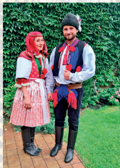
Současná podoba slavnostního kroje Kunovicka. Kunovice, 2025.