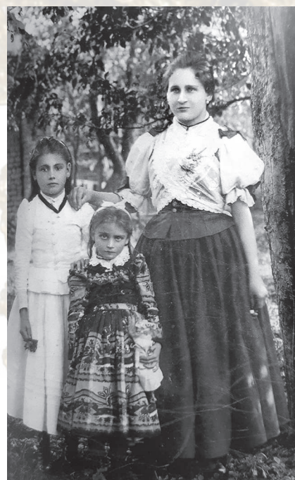
Letný odev dievčat. Nitrianske Pravno, tridsiate roky 20. storočia. Reprodukcia z knihy.