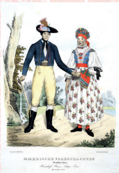
Kolorovaná litografie Wilhelma Horna. Mladý pár v lidovém kroji. Bzenecké panství, 1836. Reprodukce z knihy.

Při pořizování lidových krojů je nezbytné dodržovat základní pravidla. Důležité je vždy předem vědět, k čemu bude rekonstrukce, stylizace, imitace kroje sloužit, za jakým účelem ji tvoříme a k jakým příležitostem ji budeme oblékat.