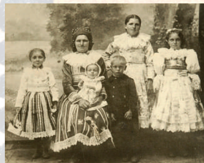
Rodina ve slavnostních krojích, batole v plátěných šatkách a čepičce, školní děti již ve zmenšenině dospělých krojů, chlapec v poměštném selském oblečku. Ostrožsko, 1920. Soukromý archiv.