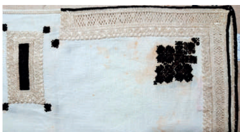
Čepce se starobylým vyšitým dýnkem a šatka s výřezovou výšivkou. Kunovice, kolem roku 1830. Fond Slovákého muzea v Uh. Hradišti.