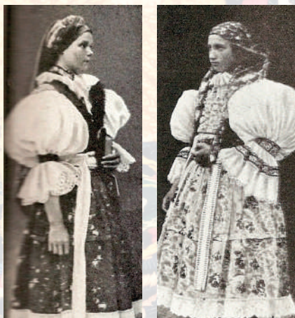
Dívka v soukenné kordulce, volných baňatých rukávcích a v polosvátečním úvazu šátku na ocas. Ostrožsko, 1892.