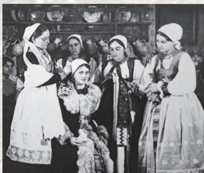
Zavíjanie nevesty, Nitrianske Pravno, druhá polovica 19. Storočia. Reprodukcia z knihy.