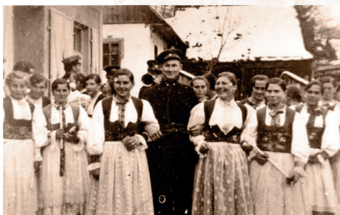
Dievčatá vo sviatočnom odevu – birmovka. Chvojnica, tridsiate roky 20. storočia.