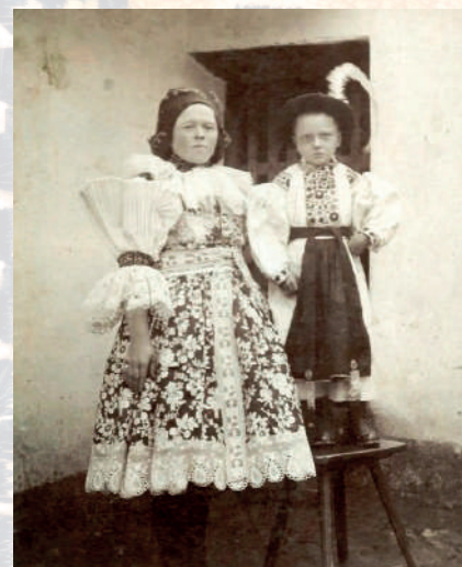
Matka s chlapcem ve slavnostním kroji – dítě v košili-dudovici s vyšívanou náprsenkou a širokými dudovými rukávy, má třaslavice se zástěrou, v kloboučku s pérkem. Blatnice pod Sv. Ant., kolem roku 1915.