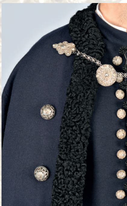
Detail lemu mužského kabáta s kožušinou a filigránovými ozdobami.