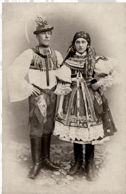
Mladý pár ve slavnostním kroji. Kyjovsko, začátek 20. století.

rukávy a plátěnou opakovací sukní. Od J. Klvani víme, že se rubáč přestal nosit hlavně kolem města Kyjova. V dnešní době se můžeme setkat s rubáčem v podobě sukénky do půlky stehen, popř. jednoduchými kalhotkami – nohavičkami .