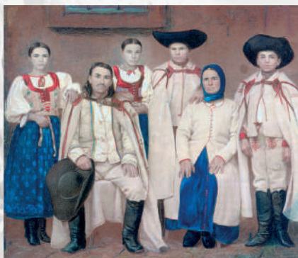
Príslušníci rodiny z Nedožier vo sviatočnom odeve. Kolorovaná fotografia, koniec 19. storočia. Reprodukcia z knihy.