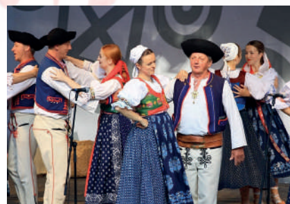
Súčasná podoba tradičného odevu z Poluvsia. Prievidza, 2016.

Z bavlnených látok sa obľube tešila modrotlač – tlačenia , tlač , ktorú predávali farbiarske rodiny v Prievidzi a v Štubni. Z nej sa šili väčšie či menšie šatky