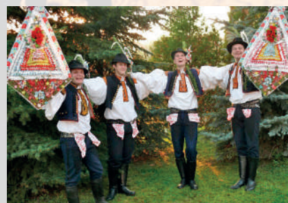
Současná podoba kroje. Slavnostní kroj mladých mužů hodové chasy. Polešovice, 2005.