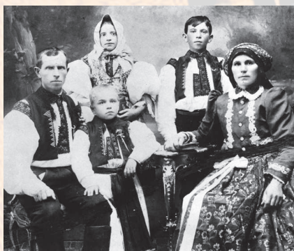
Mladá rodina ve svátečním kroji. Polešovice, kolem roku 1915.