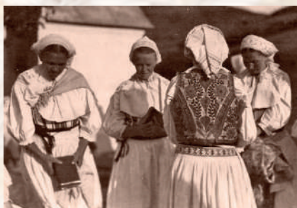
Ženy. Valaská Belá, začiatok 20. storočia.