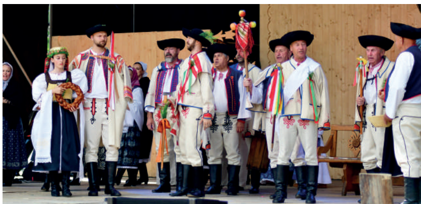
Súčasná podoba obradového odevu z Polusvia. Folklorná skupina Lubená, 2025.