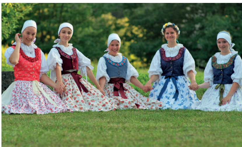
Dívky v rekonstruovaných krojích. Střílky, 2020.