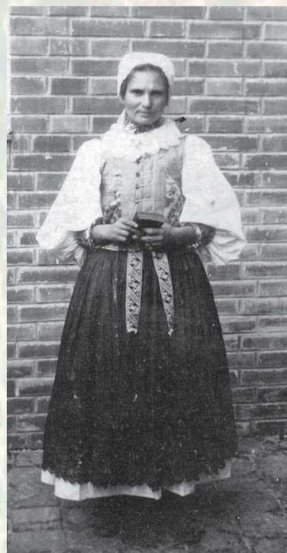
Žena pri slávnostnej príležitosti. Kostoľany, prvá tretina 20. storočia.