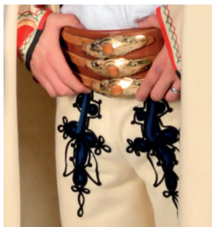
Detail výzdoby mužských nohavíc ozdobených šujtášom. Detail koženého opaska s mosadznými prackami.