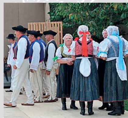
Súčasná podoba ľudového odevu, folklórna skupina Hájiček z Chrenovca-Brusna.

V letnom období chodili ženy väčšinou bosé. Iba v čase žatvy a počas chladných dní si obúvali kožené krpce . Okrem krcpov nosili boti a čizmy . Nohy mali v chladnom počasí omotané plátnom – onucami . V zime nosili kapce z bieleho alebo čierneho súkna.