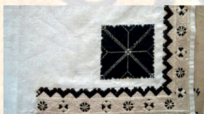
Detail výšivky na jemný výřez – roh šatky jako pokrývky ženské hlavy. Ostrožsko, kolem roku 1830. Fond Slovákého muzea v Uh. Hradišti.