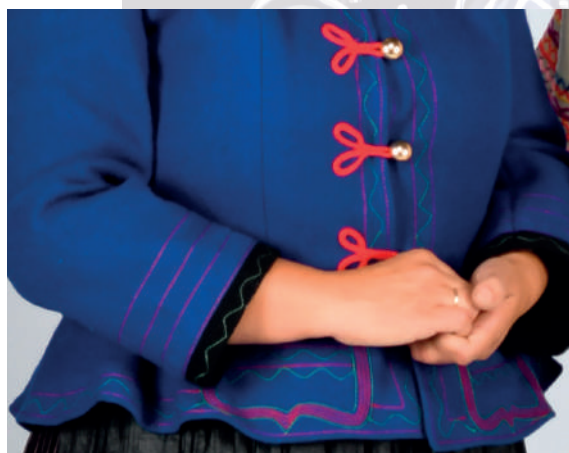
Detail výzdoby ženského zimného kabátika.