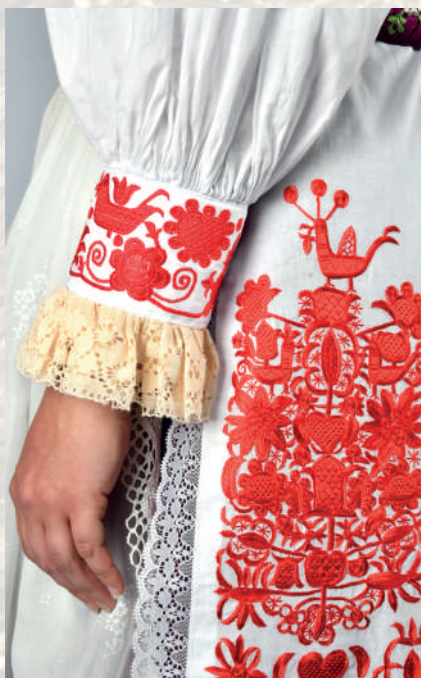
Výšivka na obalku rukávov a na konci šaty.