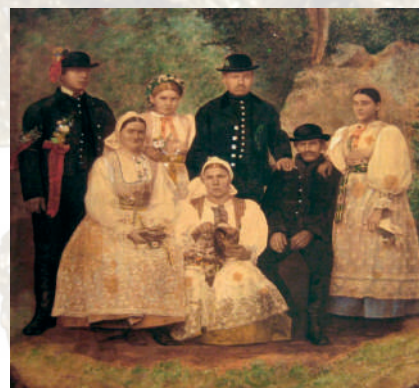
Príslušníci rodiny z (Nitrianskeho) Pravna vo sviatočnom odevu. Kolorovaná fotografia, koniec 19. storočia. Reprodukcia z knihy.