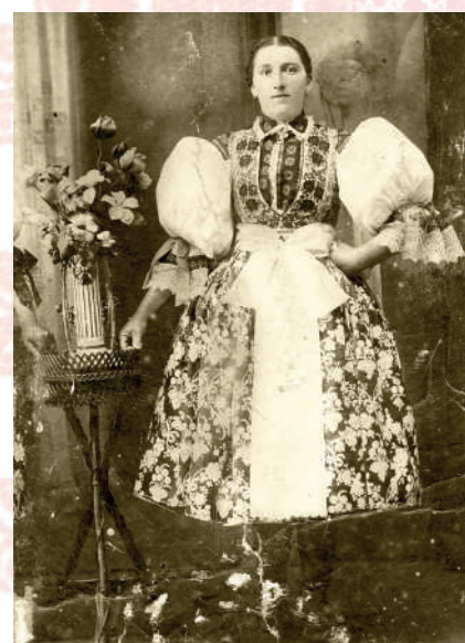
Mladá žena ve slavnostním kroji. Březolupy, kolem roku 1910. Soukromý archiv.