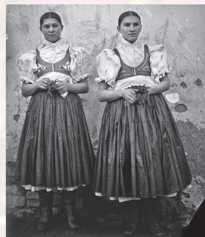
Dievčatá vo sviatočnom odevu. Handlová, začiatok 20. storočia.