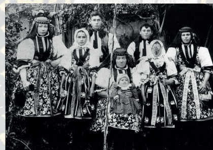
Matka s dětmi ve slavnostních krojích kunovického okrsku. Kolem roku 1915.