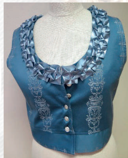
Slavnostní vestička, rekonstrukce. Střílky, 2019.