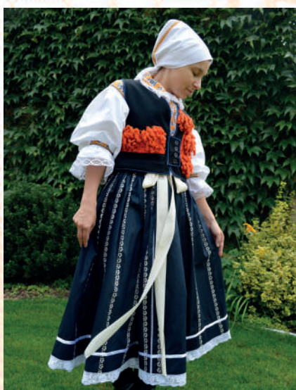
Rekonstrukce dívčího svátečního kroje kolem roku 1910 z Veselska. Hroznová Lhota, 2011.

vyčnívá z velmi krátké vestičky , které jsou na prsou do kulata vykrojené a zapínají se na jediný horní knoflík. Vzadu mají tři nenápadné šúsky a rostlinný kruhový motivek. Je stříhem podobná strážnické nebo hornácké, ale tady je šitá dohromady z jemných hedvábných materiálů v světle modrých pastelových tónech, po obvodu jsou červeně lemované nebo v červené barvě zeleně lemované. V tmavě modrých soukenných kalhotách – nohavicích – dnes muži nenosí plátěné kapesníčky, ale obvykle žluté kašmírové šátky, skládané do trojúhelníku, které více vyčnívají na levou stranu poklopce . Na hlavě nosí černé klobouky s širší krempou, zdobené vonicí s většími kohoutími péry. Na nohou nosí černé vysoké boty – holínky – s tvrdou holení částí.