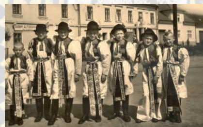
Chlapci ve svátečním kroji. Kunovice, polovina 20. století.