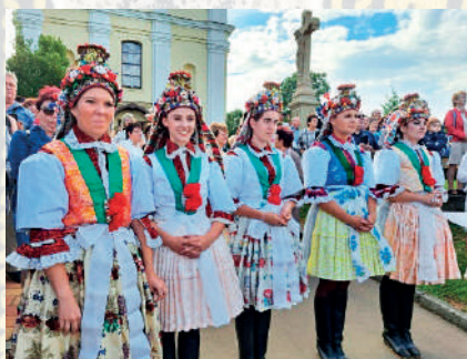
Družičky v současné podobě kroje, v obnoveném obřadním pentlení. Kunovice, 2024.