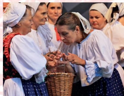
Súčasná podoba tradičného odevu z Lazian. Prievidza, 2016.