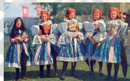
Slavnostní ženský kroj Ostrožska – volně lomené rukávce žen bez vycpávek s úvazu na náušnice konce hore. Ostrožsko, kolem roku 1915.