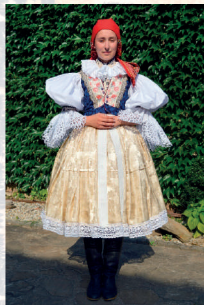
Rekonstrukce slavnostního dívčího ostrožského kroje kolem 1910, dívka je v hedvábné atlasové kordulce, volných baňatých rukávcích, v úvazu šátku na náušnice konce dole. Ostrožsko, 2012.