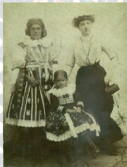
Matka s dcerkou-školačkou ve slavnostním ostrožském kroji, žena v módním městském šatu. Ostrožsko, začátek 20. století.