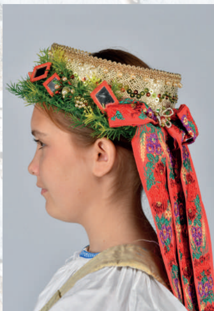
Nevesta v parte so zeleným venčekom. Rekonštrukcia.