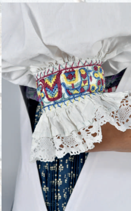
Zdobný obalok rukávov.