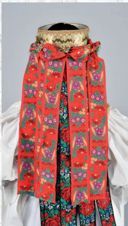
Viazanie ozdobných stúh na parte. Rekonštrukcia.

Sviatočné oplecko bolo ušité z jemného bieleho plátna z pravouhlých dielov. K prednému a zadnému dielu boli z boku prišité rukávy. Okraje jednotlivých častí boli husto nariasené do úzkeho goliera, ktorý sa uväzoval spletenými niťami alebo úzkou – cigánskou tkanicou . Predný a zadný diel mal dĺžku po pás. Široké dlhé rukávy boli na zápästí zriadené do obalku s výšivkou. Ukončené boli háčkovanou alebo továrenskou čipkou. Golier a obalky rukávov boli vyšívane hodvábnou nespriadanou niťou – pravnianskou výšivkou s florálnymi a zoomorfnými motívmi. Na golieri sa motív pravidelne opakoval. Farebnosť záležala na výbere nositeľky a prispôbovala sa farebnosti ostatných odevných súčiastok (väčšinou labjlíka).