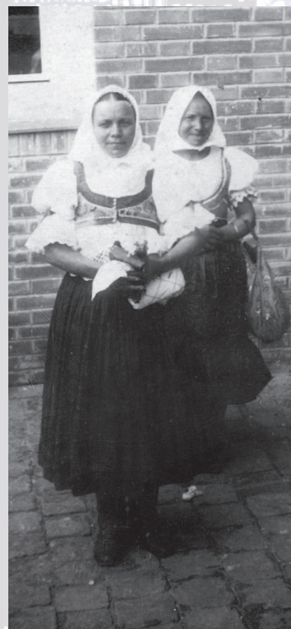
Ženy z handlovskej oblasti. Prvá tretina 20. storočia.