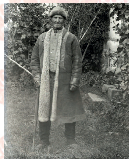
Stařeček v kozichu, Brodsko. Jan Koula, kolem roku 1900.