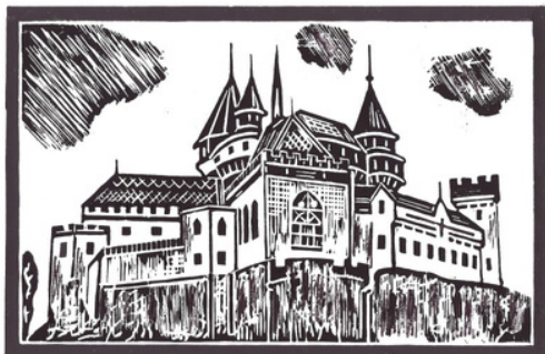
VLADIMÍR VERČEK – Bojnický zámok

Výstava AMA prezentuje každoročne najnovšiu tvorbu výtvarných umelcov z okresu Prievidza a je súčasne aj regionálnym postupovým kolom súťaže