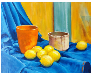
ĽUBOMÍR ABAFFY – Zátišie s citrónmi