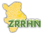
Združenie pre rozvoj regiónu Horná Nitra, Prievidza