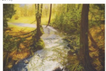
Mária Geršiová Potok v lese (olej, 2017)