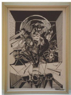
Peter Ustinov Fight (kresba fixkou, 2015)