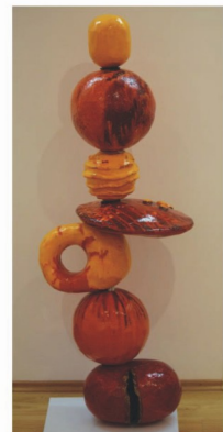
Zuzana Richmanová No name (keramika, 2016)