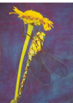
Dorota Podoláková Vážka (akryl, 2016)