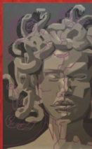
Peter Ustinov Medousa (akryl, 2016)