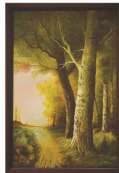
Zeno Malík Starý strom (olej, 2017)