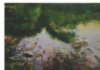
Zuzana Ballaschová Vodný odraz (olej, 2014)