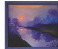
Pavel Mazák Svitanie (akryl, 2016)