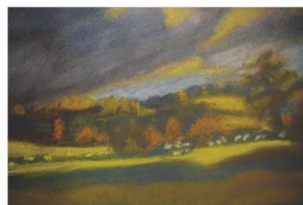
Janka Hlaváčová Pred búrkou (pastel, 2016)