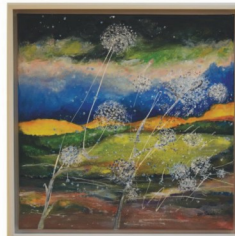
Valéria Demeterová Púpavienky (akryl, 2017)